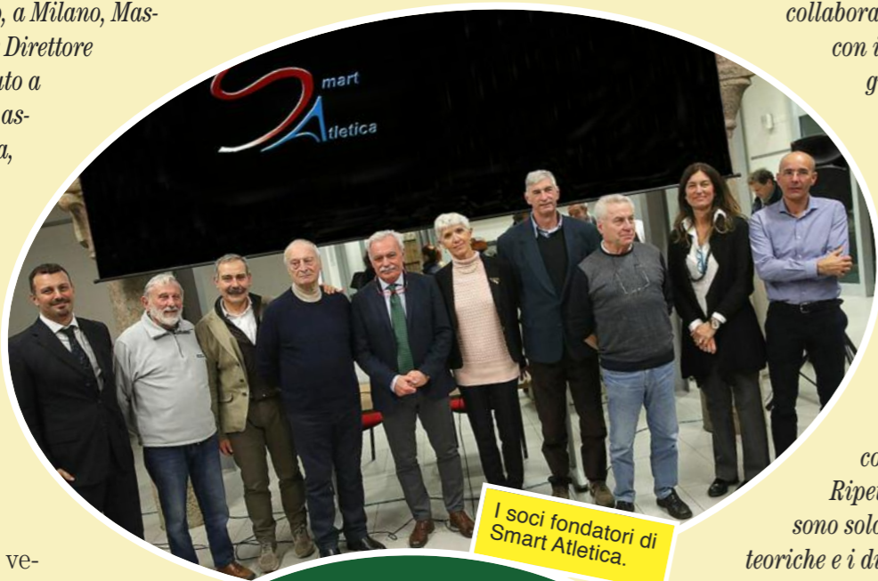
I soci fondatori di Smart Atletica.

Proviamo a speculare un poco (dal vocabolario: Attività di pensiero relativa a una sfera teorica d'indagine e approfondimento). Accendiamo le consuete retrocamere e andiamo con la memoria al dicembre 2010, quando su uno dei tanti siti dedicati all'atletica comparve una lunga lettera (non era firmata) dove si annunciava la nascita di "Passione Atletica" con queste pa-