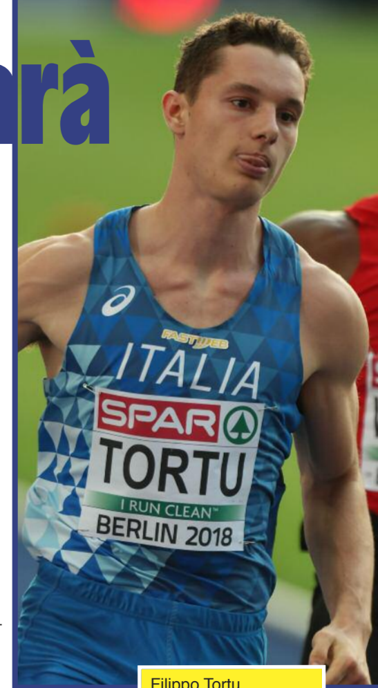
Filippo Tortu.

NON È MICA DA QUESTI PARTICOLARI CHE SI GIUDICA UN CAMPIONE UN CAMPIONE LO VEDI DAL CORAGGIO DALL'ALTRUISMO E DALLA FANTASIA